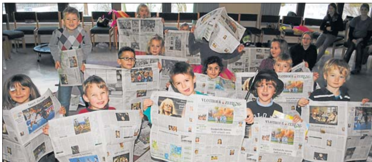
Die Zirkusartisten aus der »Villa Kunterbunt« in Exter posieren mit Ausgaben der VLOTHOER ZEITUNG für das Zeitungslied, das sie zur Einstimmung auf die Vorstellung unter dem Motto »Zirkus und Zeitung« singen.

130 Jahre VLOTHOER ZEITUNG die informative