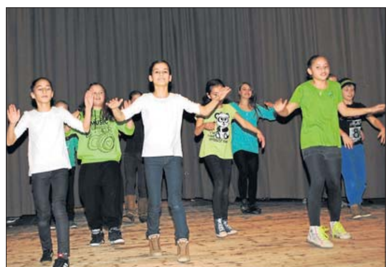
Die Schüler der Hip-Hop AG präsentieren zum Auftakt des Wintercafés mehrere Tanz-Choreographien zu den Klängen aktueller Hits.

Während der gesamten Zeit waren Schüler-Reporter unterwegs, die den Nachmittag mit Eltern-Interviews, Foto-Apparat und Filmkamera dokumentierten. Die Ergebnisse dazu werden sicher bald im Internet auf der neuen Homepage der Weser-Sekundarschule unter www.sekundarschule.de zu sehen sein.